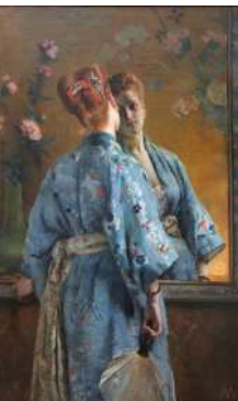
La Parisienne japonaise, Alfred Stevens (1872), huile sur toile conservée à la Boverie, Liège

De populariteit van die stroming spruit voort uit het contrast met oudere stijlen die vaak inspiratiebron waren van Europese producties.