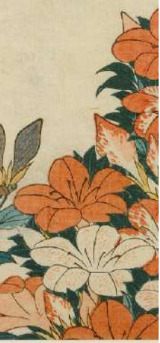
Gravure sur bois ukiyo-e d'un coucou et d'azalées (détail), Hokusai (1828)

À l'instar des faïences de Delft, des plats décoratifs d'Iznik ont également été achetés par la faïencerie Boch pour servir de modèles aux peintres. À droite, une véritable pièce issue des ateliers d'Iznik en faïence stannifère ; à gauche, une imitation du même décor réalisée par Ernest Tondeur.