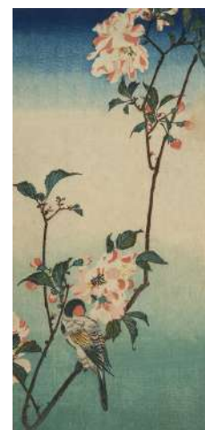
Gravure sur bois d'un petit oiseau sur une branche de cerisier, Hiroshige (1833)

Tussen de mooiste voorbeelden van Japoniserende schilderijen op faïence bij Boch, vermelden we een groot wandbord getekend "De Burges", waarop een zwaluw op een tak van een bloeiende kersenboom afgebeeld staat. De keuze van de zwaluw is natuurlijk niet onbeduidend, vermits die vogel vaak voorkomt op Japanse etsen.