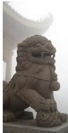
Statue en pierre d'un lion gardien chinois au Mont Emei en Chine

De artiesten van de "Chambre des peintres" staan ook bekend voor het ontwerpen van figuurtjes, vaak in de stijl van Delft zoals voor deze Chinese leeuw. Deze traditionele Chinese figuur, die ook shi genoemd wordt, werd aan de ingang van tempels, paleizen, administratieve gebouwen... geplaatst.