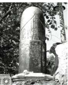
Lingam de Wat Pôt, Thaïlande

Avec les « Stèles » qu'il réalise au milieu des années 1970, il tire son inspiration des "lingam de Wat Pôt" en Thaïlande (2).