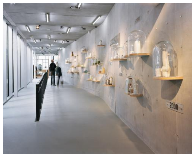
Espace du mur design © Marie-Noëlle Boutin

Chaque année, Keramis explore l'univers de la céramique à travers des expositions temporaires destinées à promouvoir une discipline méconnue et pourtant millénaire. À côté des rétrospectives de figures historiques, le musée consacre une large part de sa programmation à des expositions collectives ou personnelles d'artistes contemporain·e·s.