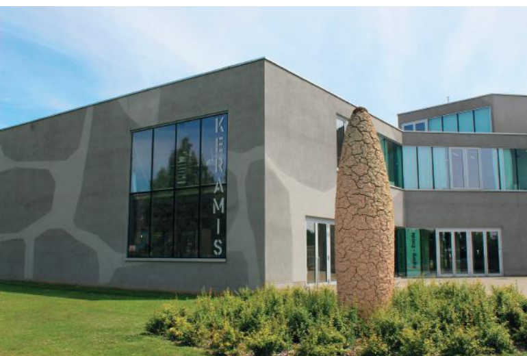
Façade du musée avec l'intervention de Jean Glibert et l'œuvre d'Émile Desmedt

Aujourd'hui, Keramis abrite plus de 11 000 œuvres céramiques allant des premières pièces sorties de la faïencerie louviéroise jusqu'aux créations d'artistes contemporains (Antoine de Vinck, Johan Creten, Françoise Pérovitch, Marc Alberghina, Bai Ming, Tony Cragg...).