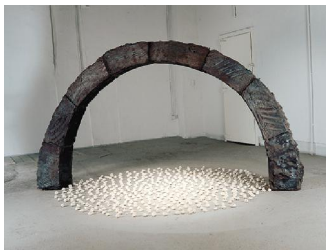
Arche noire, 1981, grès, porcelaine. Collection du Musée d'Art Moderne de Paris