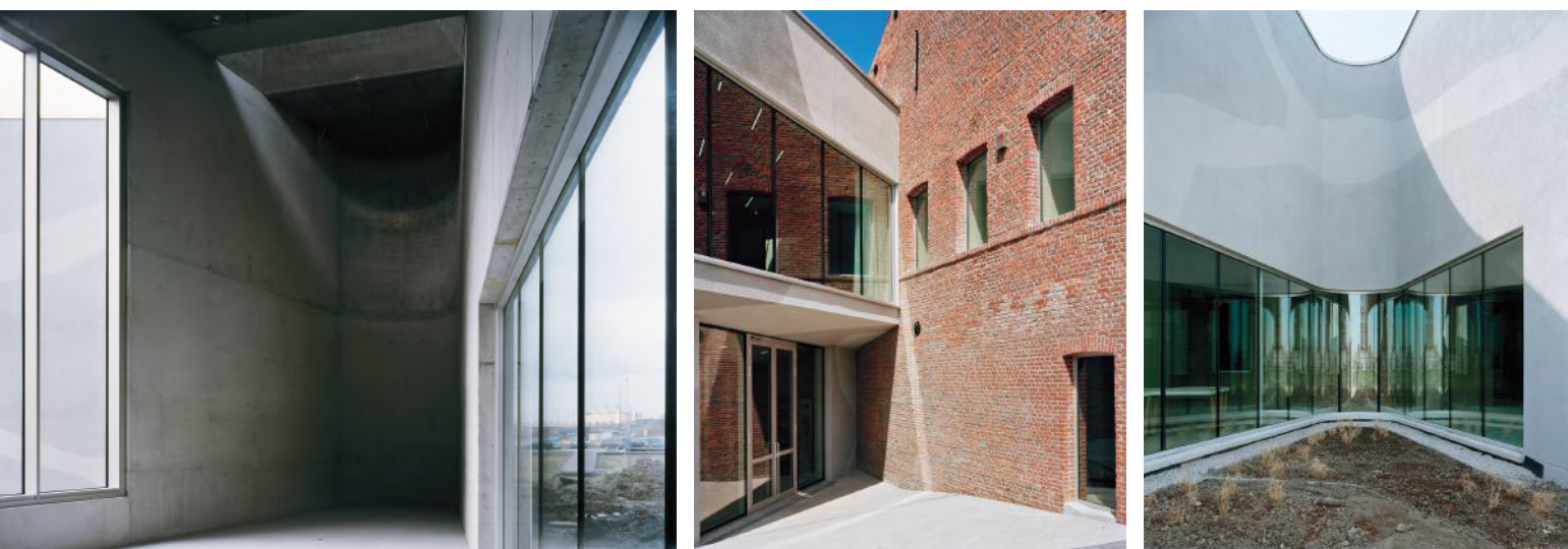
Vues intérieures et extérieures de Keramis - intervention sur façade de Jean Glibert

Aujourd'hui, Keramis abrite plus de 10 000 œuvres céramiques allant des premières pièces sorties de la faïencerie louviéroise jusqu'aux créations d'artistes contemporains (Antoine de Vinck, Johan Creten, Françoise Pérovitch, Marc Alberghina, Bai Ming, Tony Cragg...).