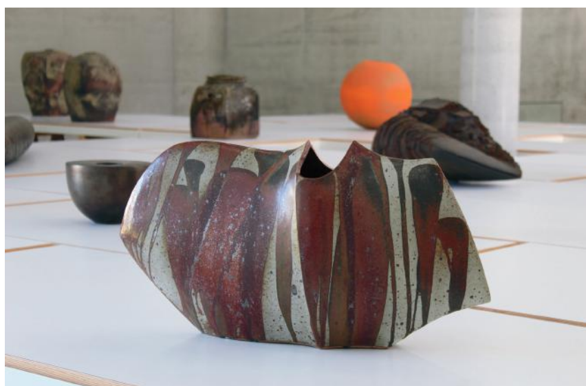
Vues de la salle 20e-21e siècles de Keramis