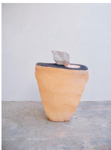
Pierre en suspens, 2020, terre cuite, feldspath © Daniel Pontoreau

Pour l'exposition, Keramis a bénéficié en outre de prêts exceptionnels de collectionneurs privés mais aussi du Musée d'Art Moderne de Paris et du Cnap, le Centre national des arts plastiques.